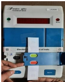
ग्रीन पेपर सील लगाना