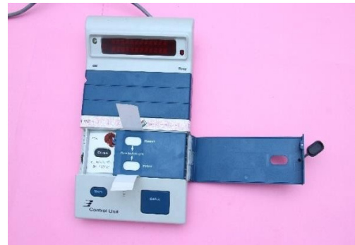
आन्तरिक परिणामी सेक्शन को स्पेशल टैग के साथ सील करना